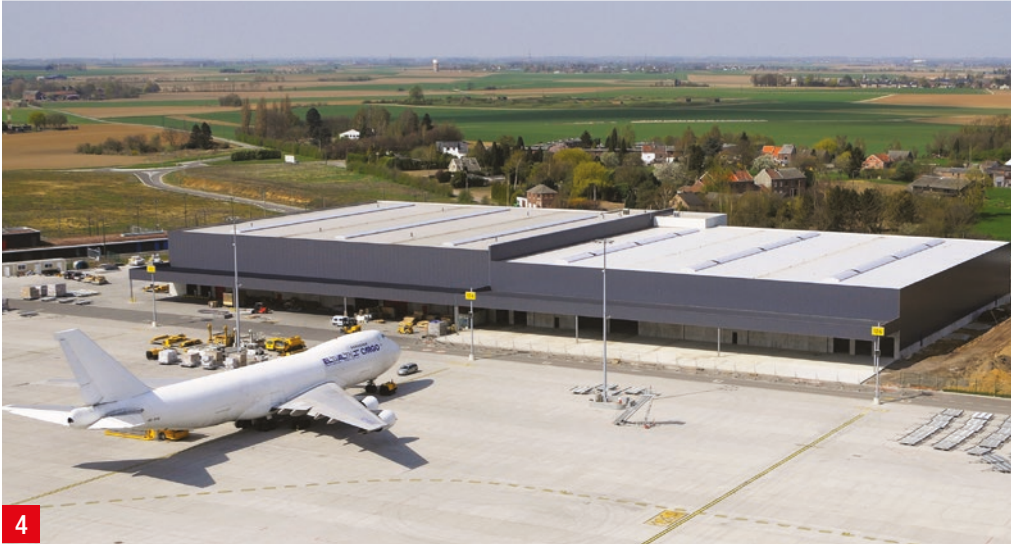
LIEGE AIRPORT 4 Construction de 5 halls de traitement de fret aérien et bureaux de plus de 65.000 m 2 – Bierset Architectes : ALTIPLAN® et Bureau d'Architecture Greisch