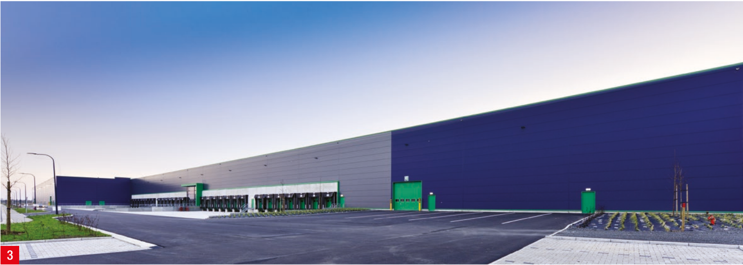
D.L. TRILOGIPOINT BELGIUM 3 Construction d'un hall logistique de 44.500 m 2 sur le site du Trilogoport – Hermalle-sous-Argenteau Architecte : Biemar & Biemar